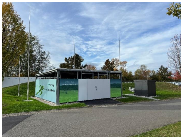
Abb. 1 Das neue H 2 -Kraftwerk an der Forschungsfabrik des Fraunhofer IWU. Unmittelbar macht es Wasserstoff als Energiespeicher für die Forschungsfabrik nutzbar.